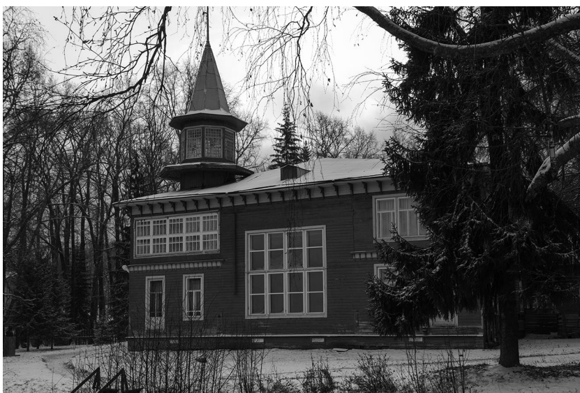
Рис. 2. Дом-усадьба (ныне музей) А.А. Борисова (Архангельская обл., Красноборский район, деревня Городищенская, д. 19).

В этот период Борисов почти не касался темы Заполярья, среди 23 его работ только 2 являются воспоминаниями о полярных экспедициях – «Полночь во льдах» (1913) и «На моржа (эскиз)» (1914). Ещё несколько работ представляли собой архитектурные пейзажи Соловецкого монастыря. Но преобладающей темой полотен того периода являлись родные для Борисова северодвинские пейзажи, «по преимуществу леса в зимнем наряде, ели, одетые в тяжёлые снежные шубы» [9, с. 14].