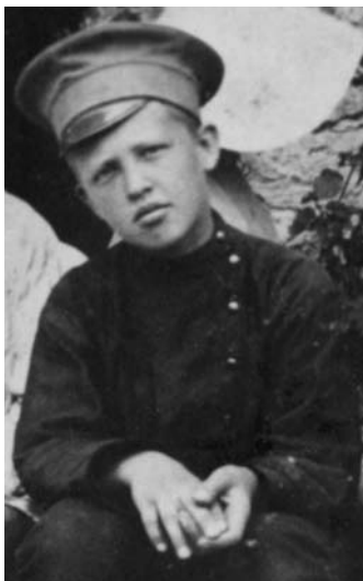
Володя — реалист

Ни они, ни обслуживавшие чайную училища дамы из попечительского совета не считали для себя унижительной эту «техническую работу». Мальчики росли среди мужчин и привыкали чувствовать себя мужчинами. На переменах в любую погоду их выпускали побегать на большой двор позади здания училища.