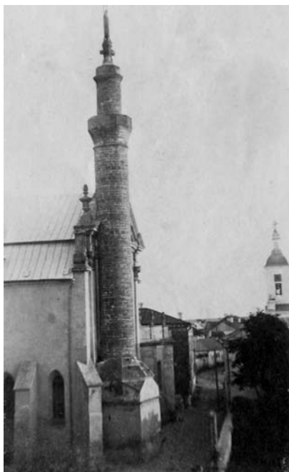
Старинная православная церковь в Каменец-Подольском

и костел, и синагогу и армянское подворье. Особенно интересна одна церковь, в архитектуре которой отразилась история края. При турецком господстве христианский православный храм превратили в мечеть, пристроив к нему минарет. Под властью Польши храм стал униатским, а на вершине минарета водрузили статую Пресвятой Девы Марии. А когда в 1795 году Каменец-Подольск вошел в состав России, храм снова стал православным. На крыше установили православный крест, оставив и статую Пресвятой Девы.