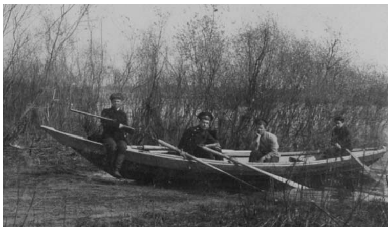
Реалисты в походе на лодке

Побывали друзья и на берегах сказочного озера Светлояр («Светлый берег»). Говорят, что на дне его покоится Китеж-град, который иногда можно видеть. Согласно другой,