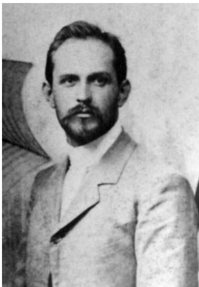
Ипполит Осипович Снежинский

жизнь», «Пчеловодство», «Малорусские домашние лечебники XVIII века», 1890 г. издания). В Слободке им было создано шестилетнее церковно-приходское училище и построен для него дом. Здесь дед учительствовал, летом же в доме жили внуки и гости. Дом училища считался лучшим в селе. Дом о. Осипа мало отличался от домов прихожан: одноэтажный, глиняный, под соломенной крышей.