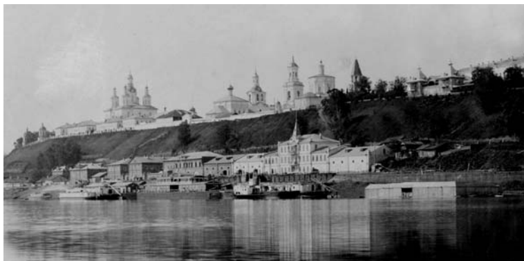
Вид на город Вятку с реки

«Крутогорск расположен очень живописно. Когда вы подъезжаете к нему летним вечером со стороны реки и глазам вашим издалека откроется брошенный по крутому берегу городской сад, присутственные места и эта прекрасная группа церквей, которая господствует над всей окрестностью, вы не оторвете глаз от этой картины. Темнеет. Огни зажигаются и в присутственных местах, и в остроге, стоящих на обрыве, и в тех лачужках, которые лепятся тесно внизу, подле самой воды; весь берег кажется усеянным огнями. И Бог знает почему, вследствие ли душевной усталости или просто от дорожно-го утомления, и острог, и присутственные места кажутся вам «приютами мира и любви», лачужки населяются Филемонами и Бавкидами, и вы ощущаете в душе вашей такую ясность,