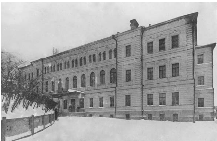
Здание НВРУ на Большой Покровке, 1913 г.

богатых и дворянские институты для «элиты» — 120 и более рублей в год.