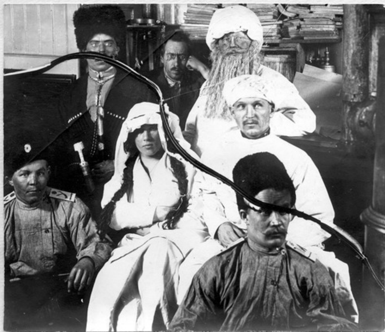
(22) Масленіца 1913. Точка сьєржаків тин "Тамар". Среди вери автор. Теронин "игра" майрор Пусотиний, Кавказу динник.