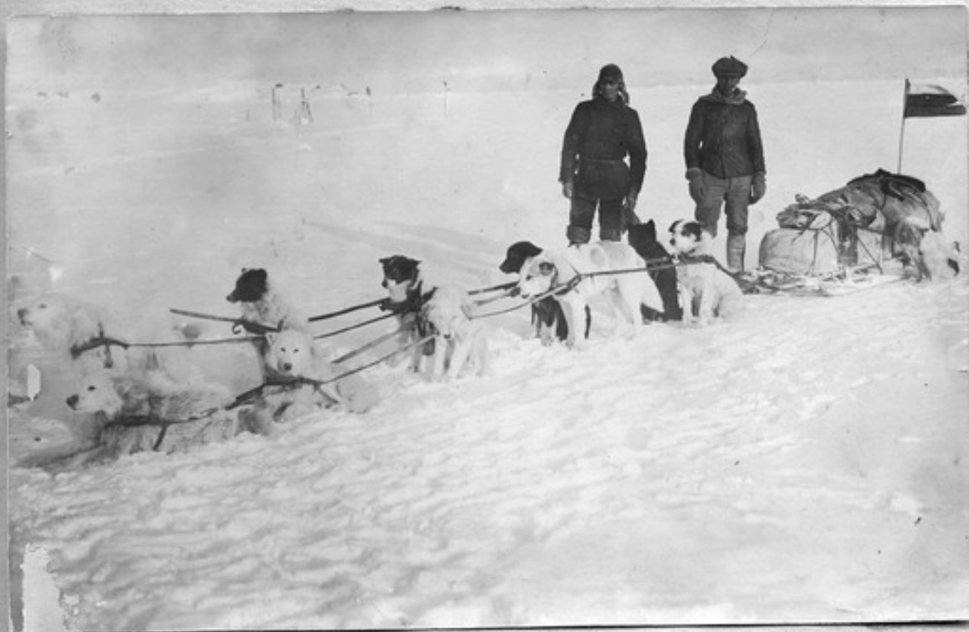
После лунной экспедиции. 15 апреля 1913 года. Возвращение самой экспедиции с ледяного покрова Новой Земли Видим со мной спутника Личиник, мой спутник. Снего у судна, Впереди. Мороз -18°C.