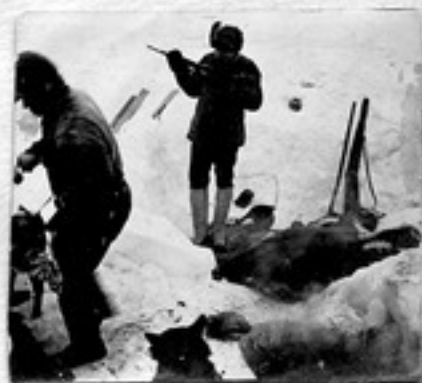
После погрузки погрузки открытия медвежьей -220 в. Сборы в даче мужа.