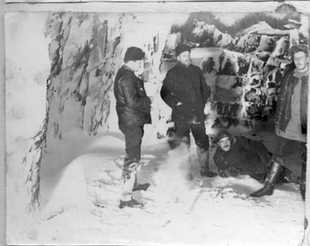
В урочище Троцкая в полярную пог.