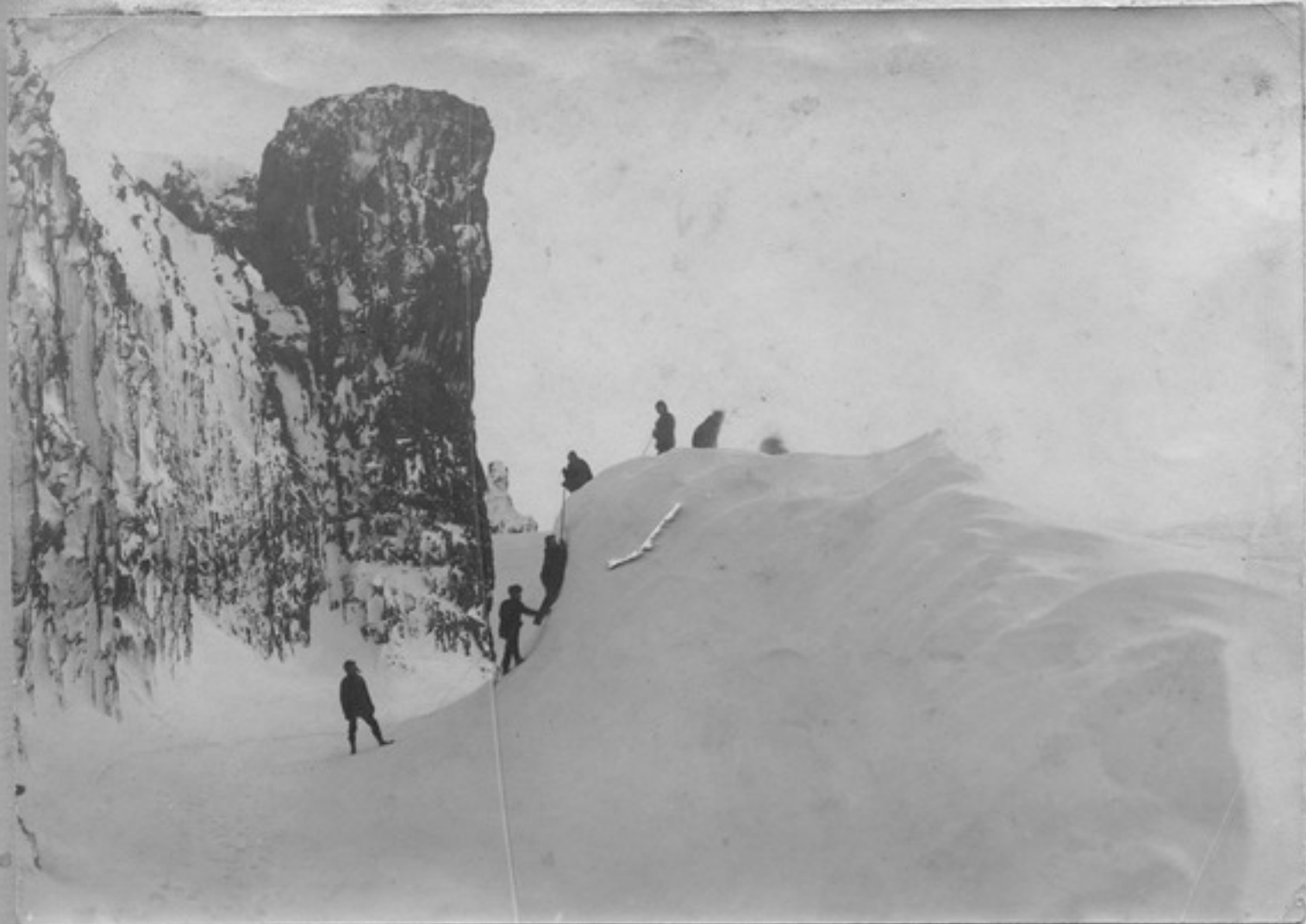
Лунная ночь. Табуэ троја. Декабрь 1913. Проулка, Грунта расположенная на снежном сугробе наиболее изломанной Винсу д.