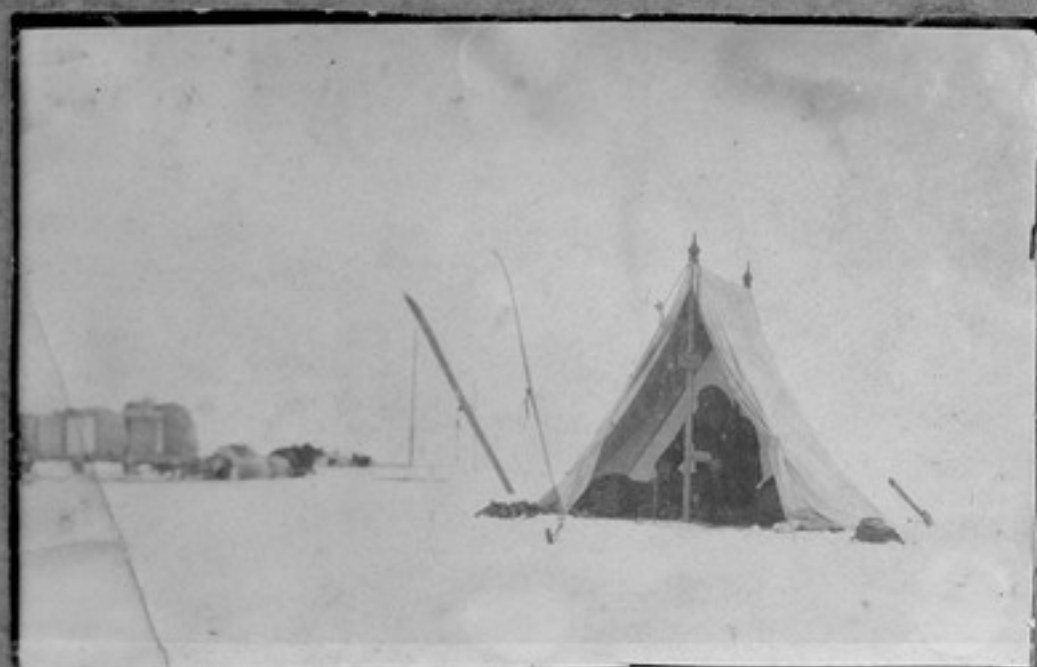
Мой лагерь на северном полюсе в надежде увидеть