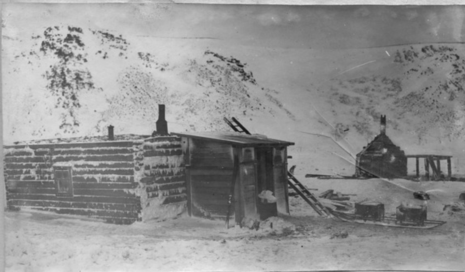
Знаювка. Баня и собачья кухня.