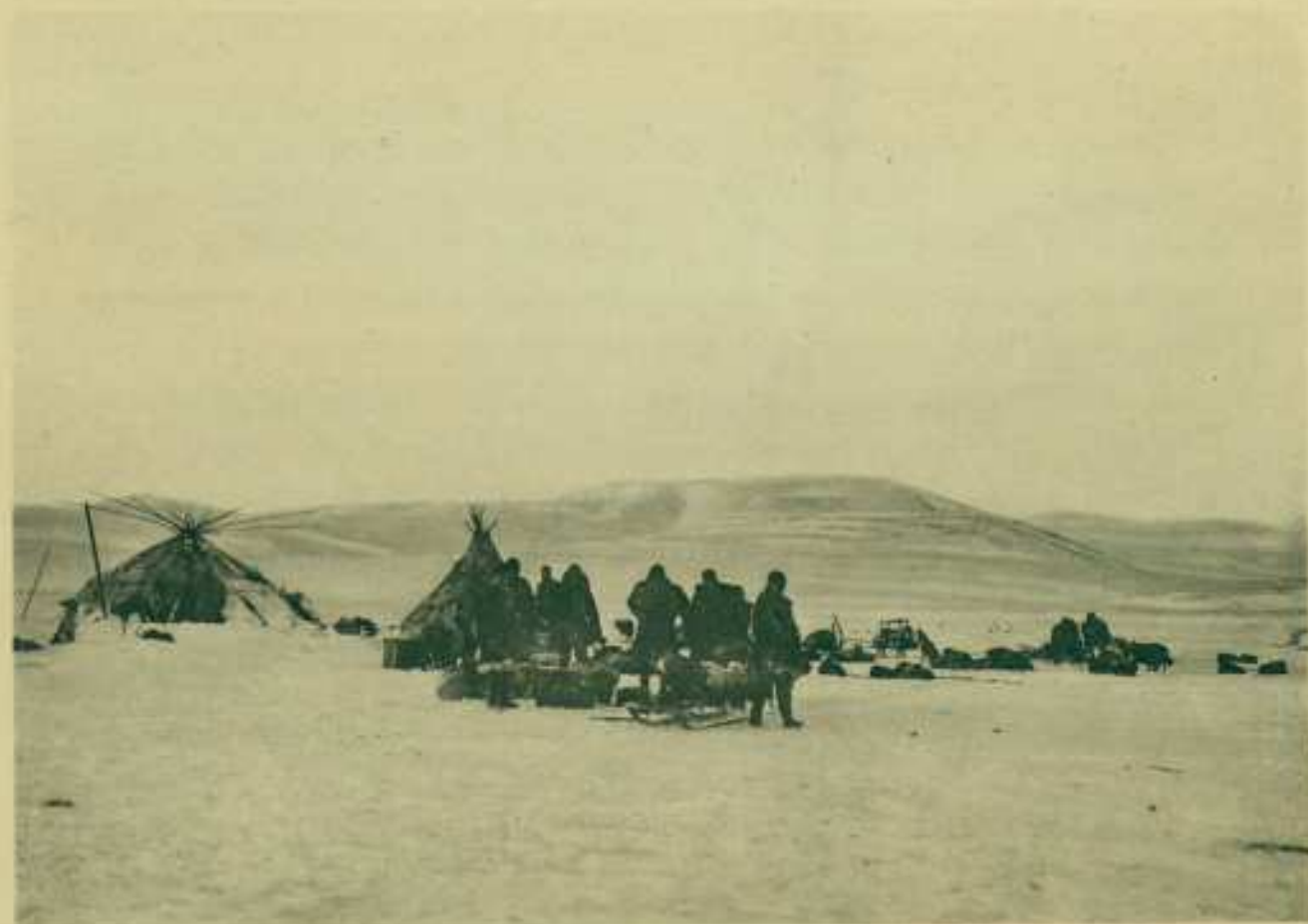
1. Лагерь экспедиціи у р. Яирагайвеямъ \frac{3}{4} х. На заднемъ планѣ возвышенности Шелагскаго мыса.