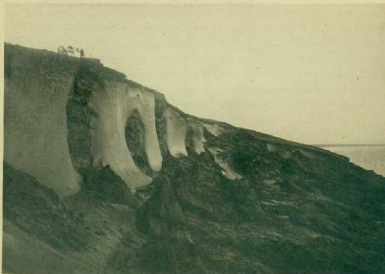
2. Почвенные льды на берегу океана у Большой рѣки.