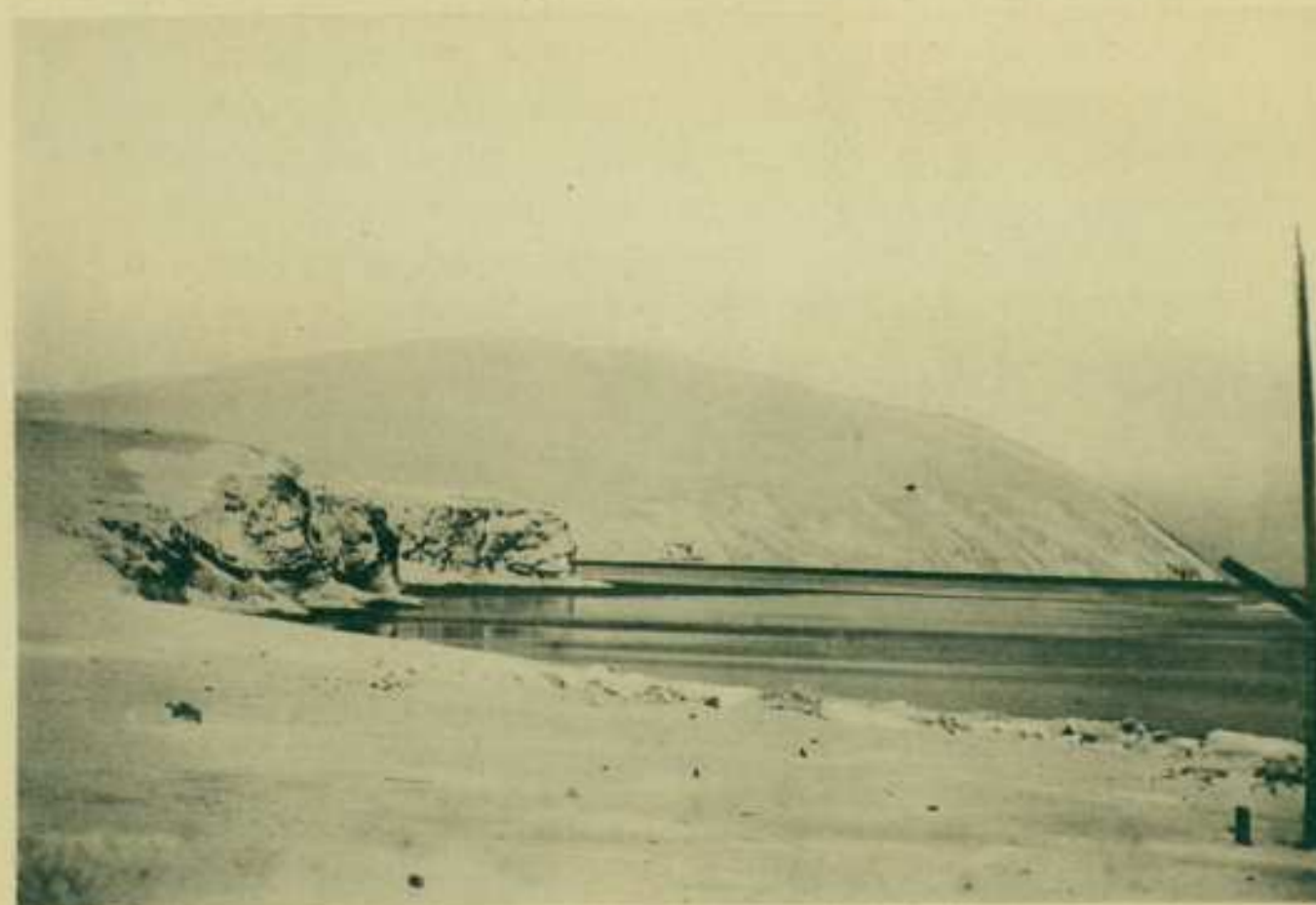
2. Мыс Дежнева отъ поста Дежнева 25/х.