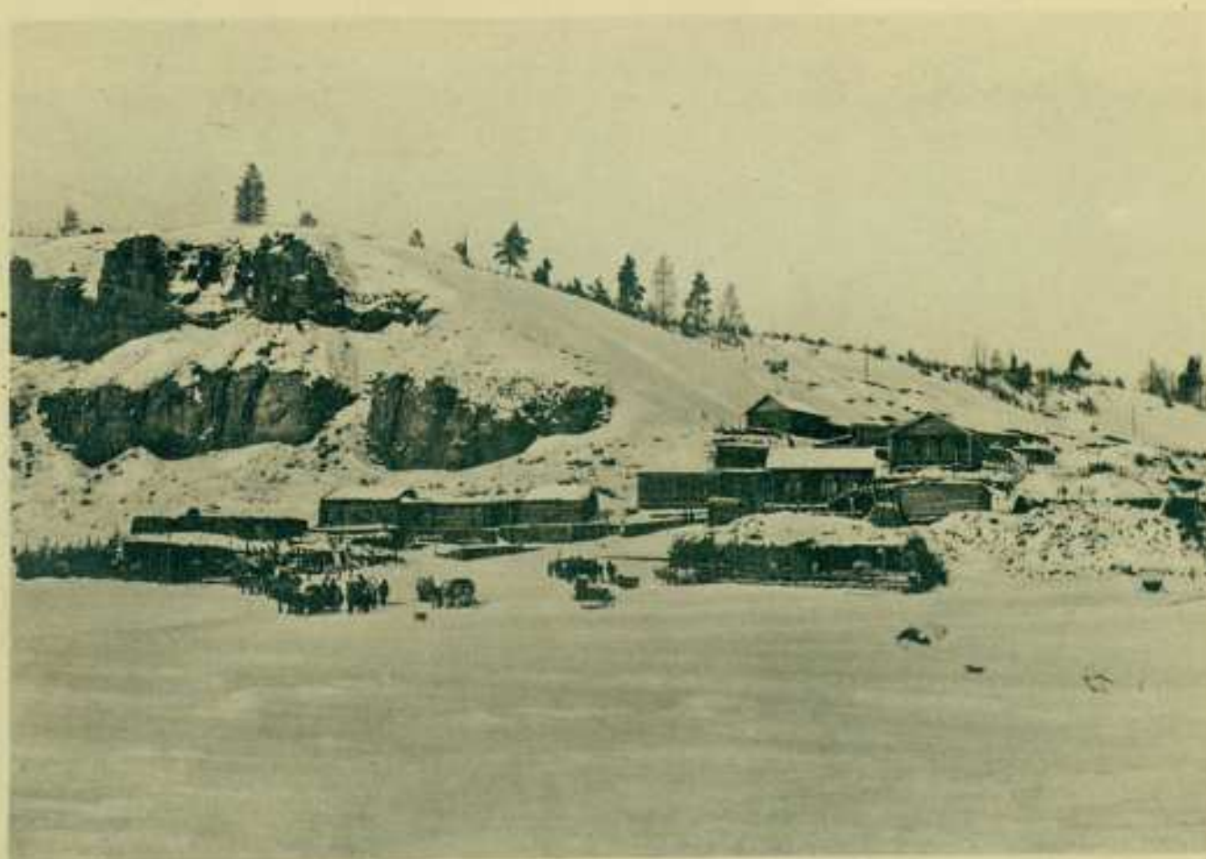
2. Станція Тоень-Аринская: на Ленѣ.