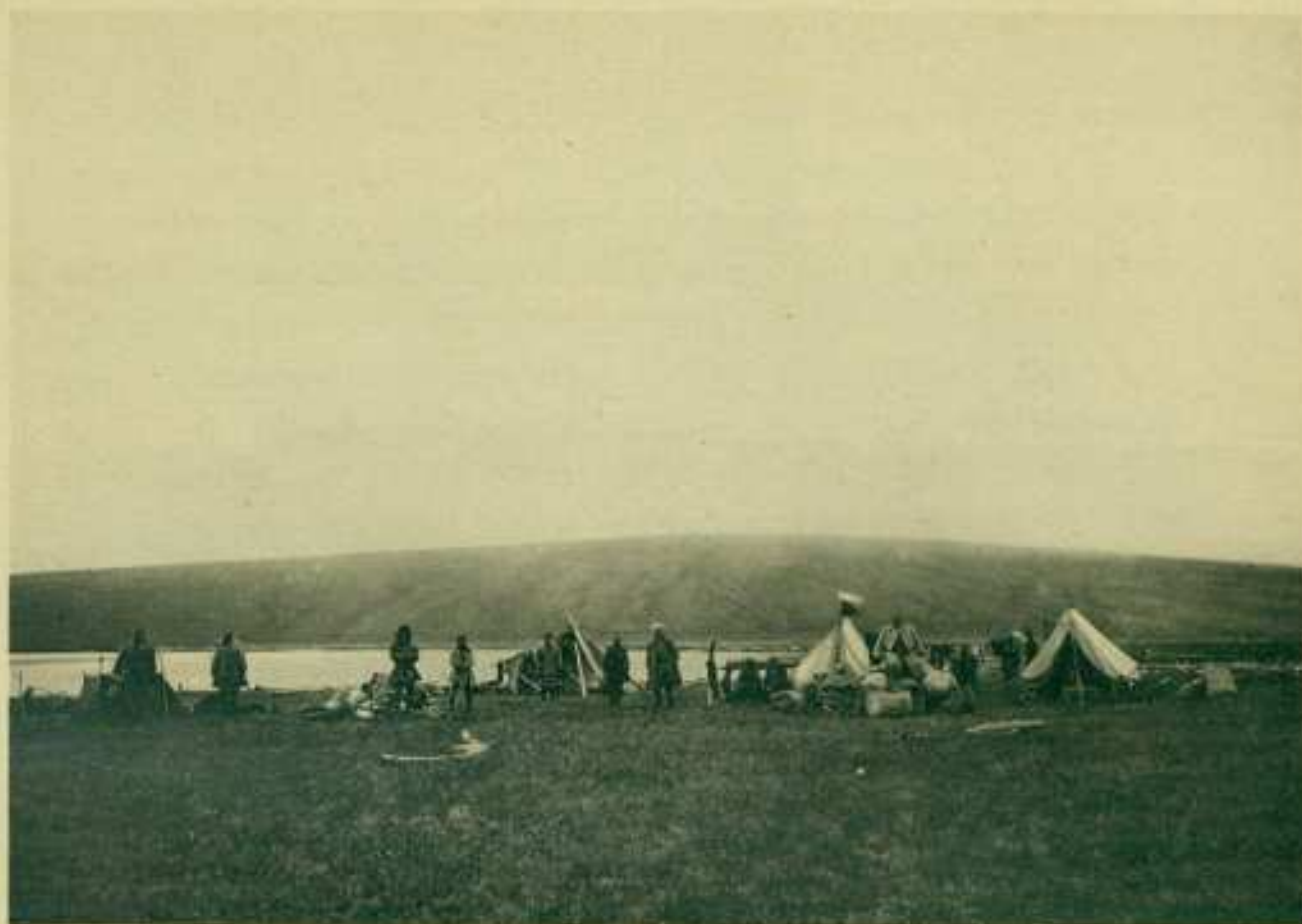
1. Лагерь экспедиціи на р. Медвѣжьей.