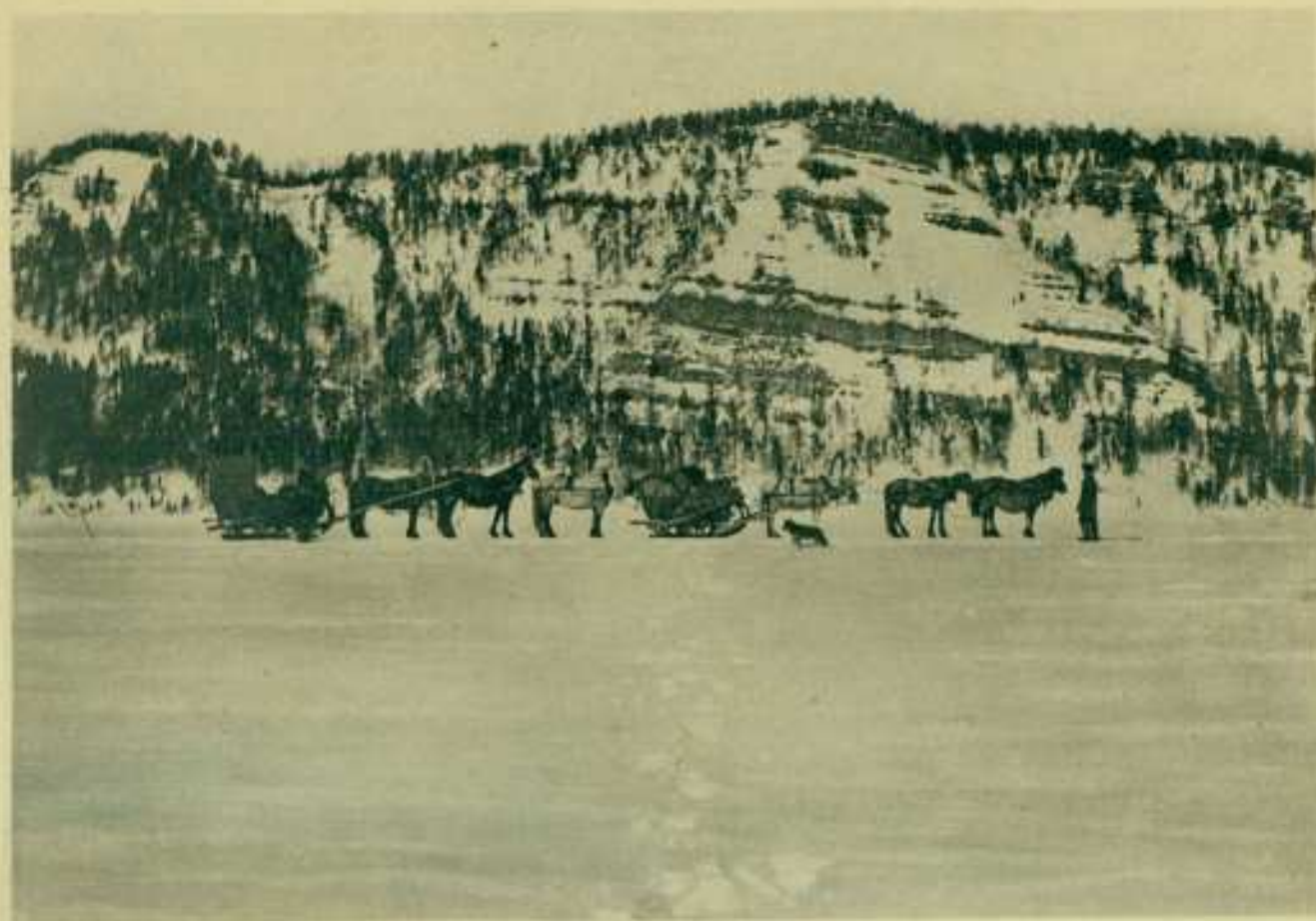
1. Передвиженіе по Ленѣ.