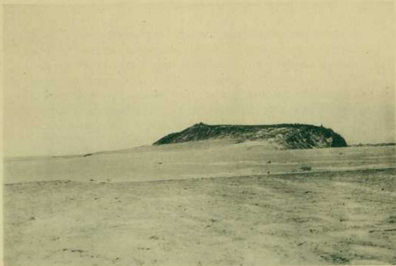
1. Мыс Рыкайпий, Утесъ Кожевникова.