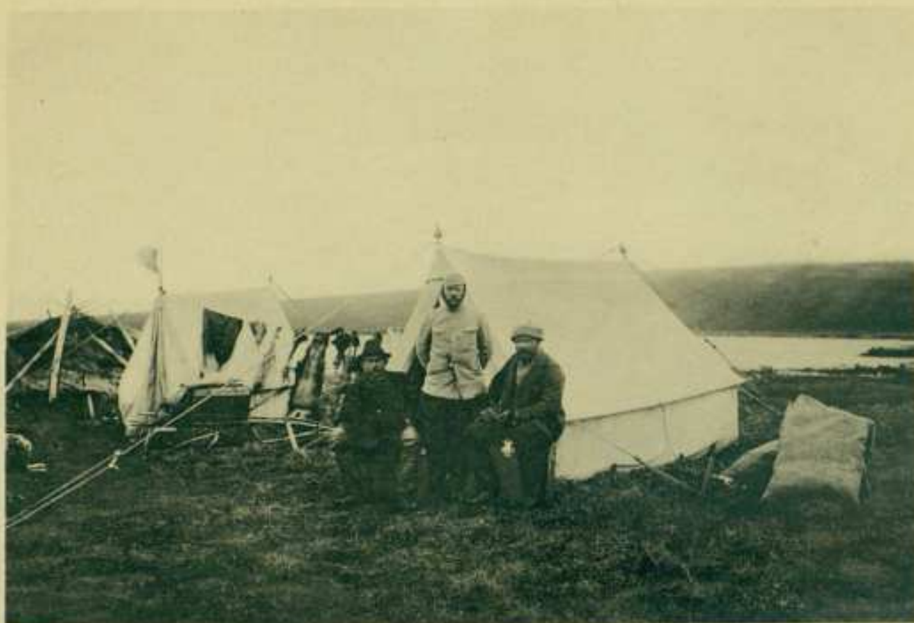
1. Экспедиція на р. Медвѣжьей. (Толмачевъ, Кожевниковъ, Веберъ.)