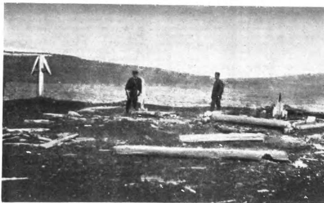
Памятная доска, найденная в 1897 году близ могилы Якова Чиракина на полуострове его имени.

Развалины зимовья отряда М. Губина и памятный крест на мысе Дровяном. Фото 1897 года.