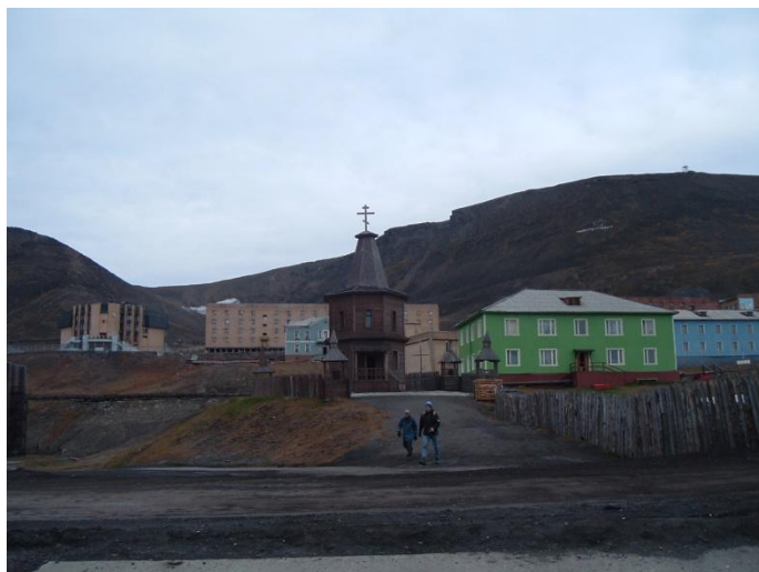
Баренцбург. Порт. Часовня в память погибших в авиакатастрофе 1996 года.