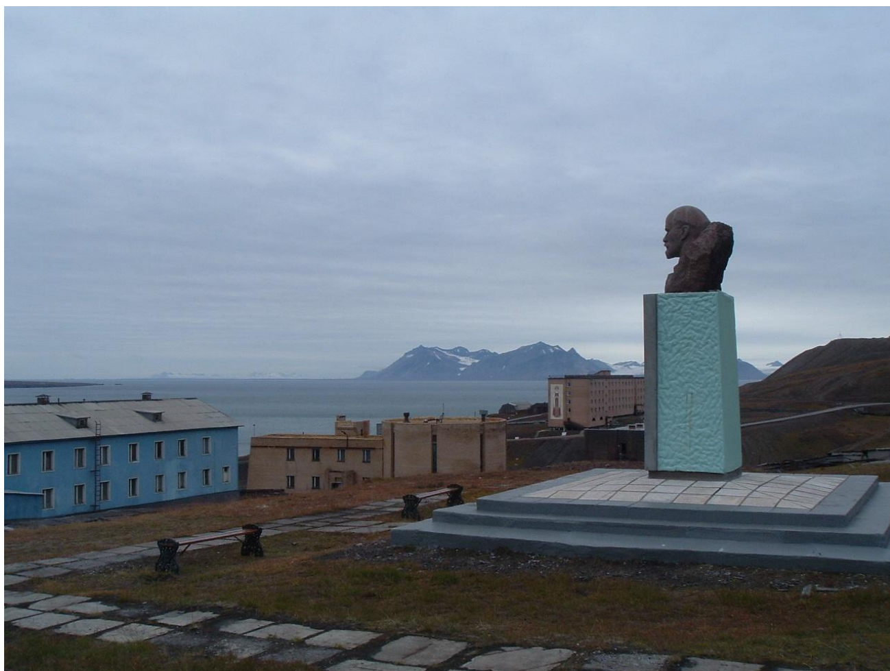
Баренцбург. Вид на выход из Грин-фьорда в Ис-фьорд.