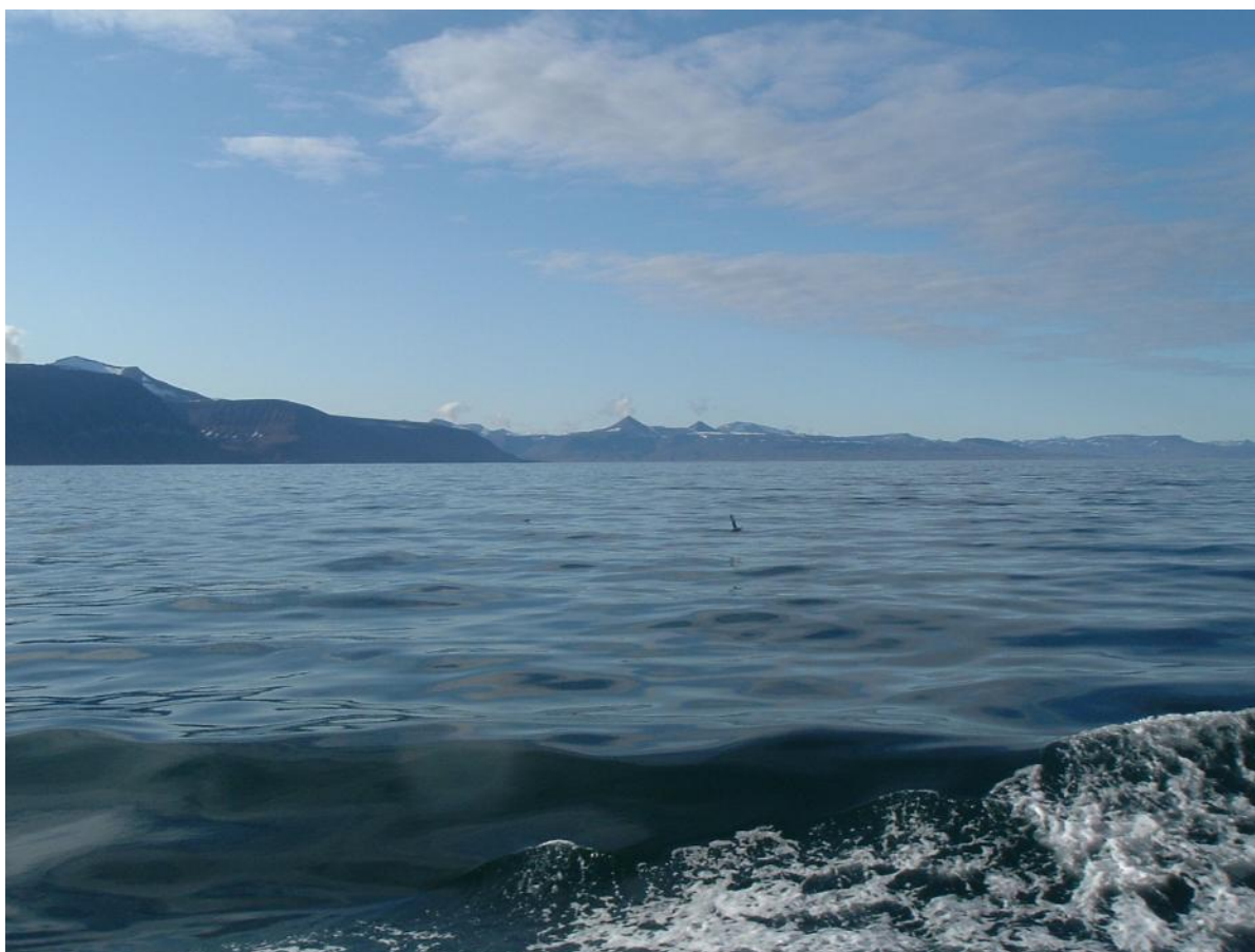
Ис-фьорд. Рудники Грумант и Баренцбург.