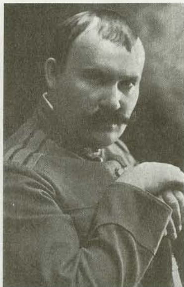
Генерал-лейтенант Г.М. Семенов