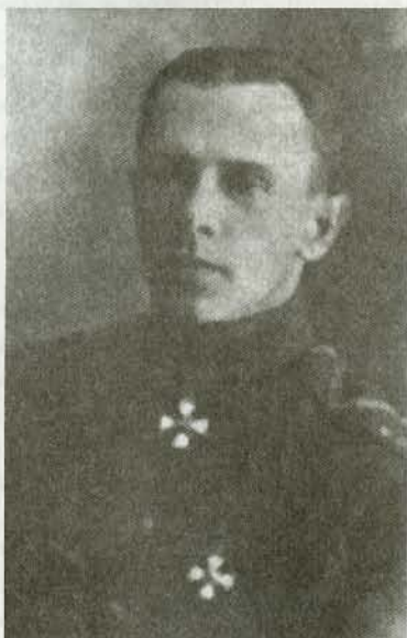
Генерал-майор С.Н. Войцеховский