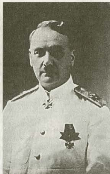
Контр-адмирал Г.К. Старк