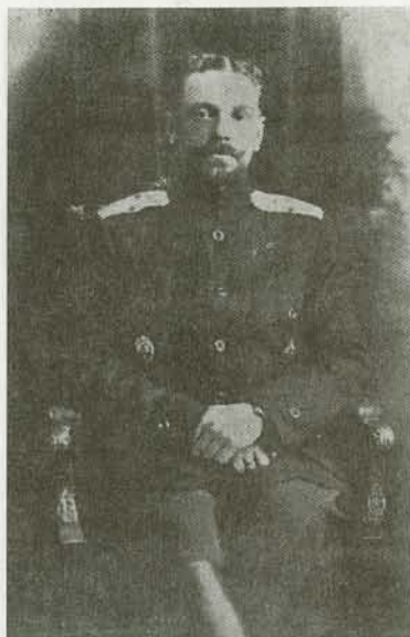
Генерал-лейтенант В.О. Капель