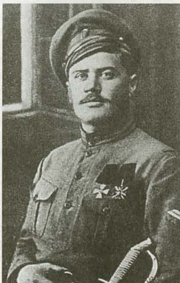
Генерал-лейтенант А.Н. Пепеляев