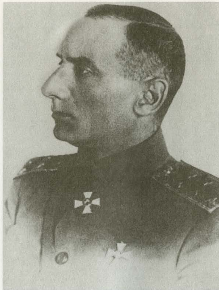
Адмирал А.В. Колчак