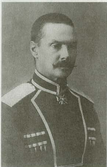
Генерал-лейтенант П.П. Иванов-Ринов