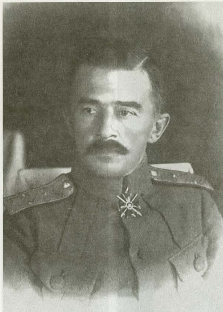
Генерал-лейтенант М.К. Дитерихс