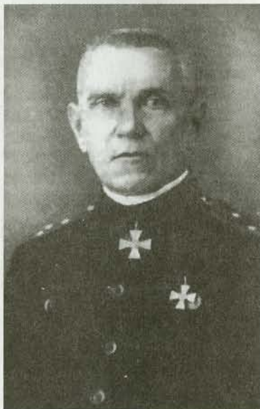
Генерал-лейтенант Г.А. Вержбицкий