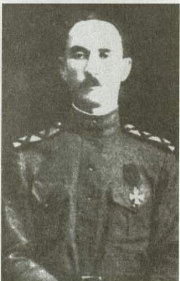
Генерал-лейтенант И.С. Смолин