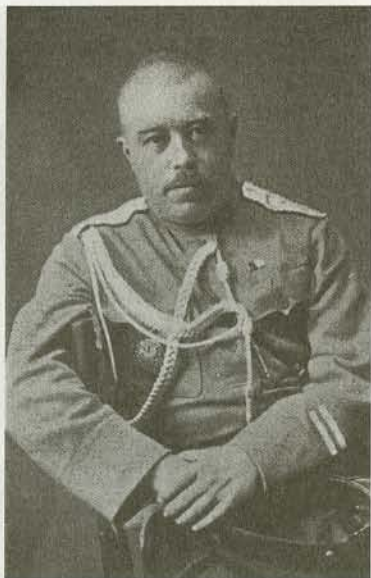
Генерал-лейтенант А.И. Дутов