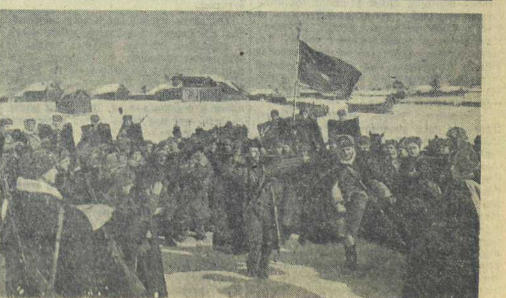
В действующую армию прибыли казачьи добровольцы. На собственных козловых